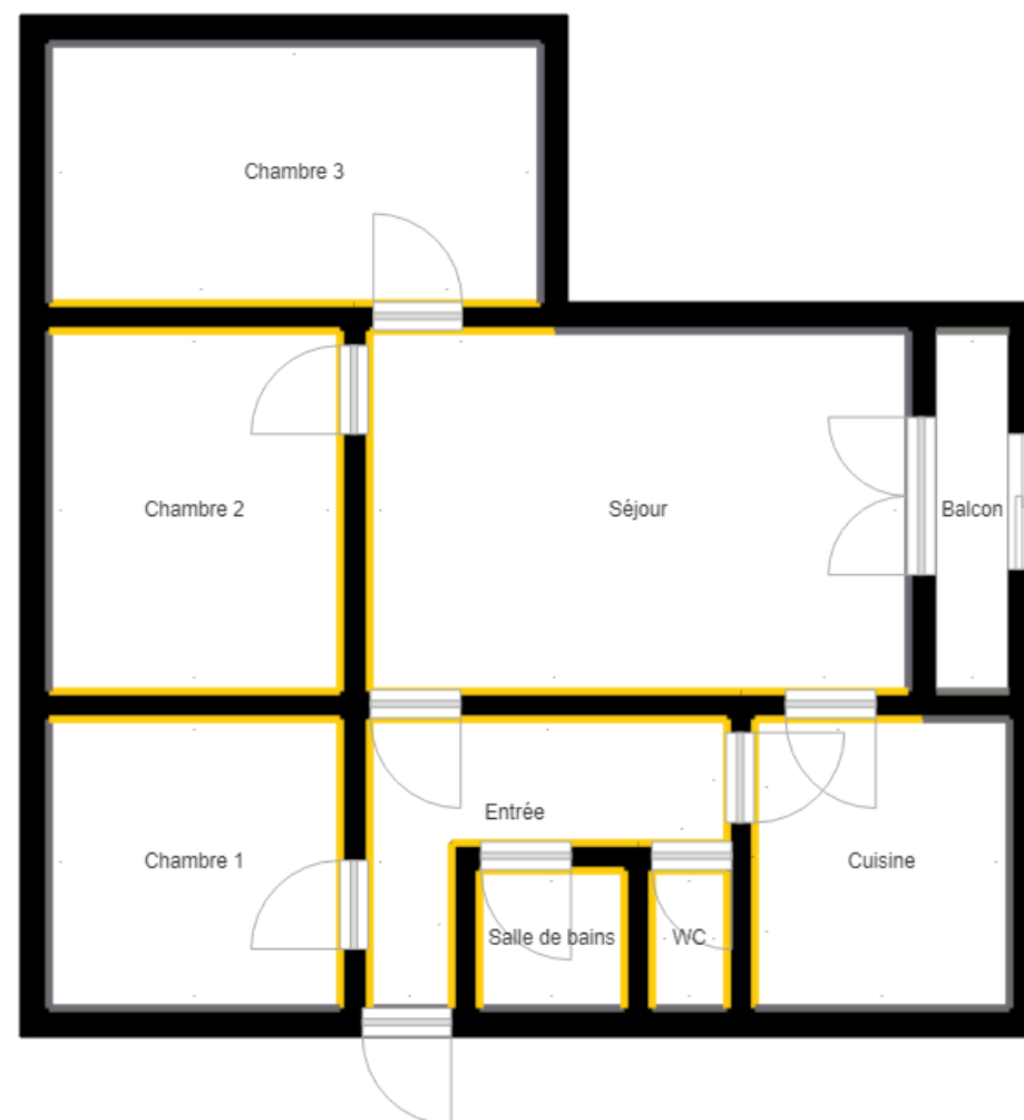
PLANCHE DE REPERAGE

Bien : 448LAQ0202 - 218 34 ALLEE DES CEDRES 77400 LAGNY SUR MARNE